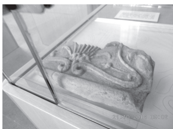
Antepagmenta dagli scavi della zona del santuario/tempio di Piano dei Tivoli (Morra De Sanctis, AV)