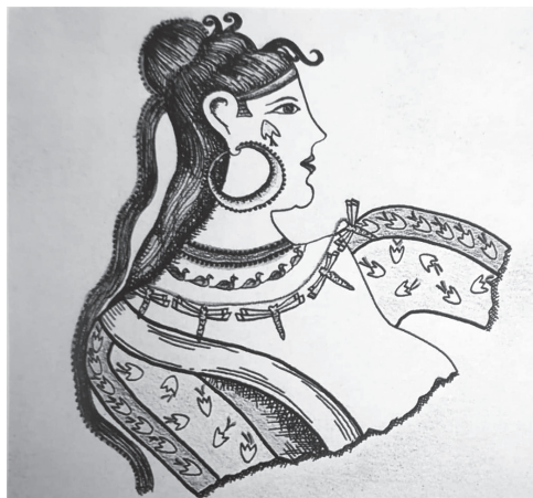
Esempio di raffigurazione di crochi sulle vesti di una divinità cretese (da "Le orse di Brauron, un rituale di iniziazione femminile nel santuario di Artemide" Cit. supra in nota.)