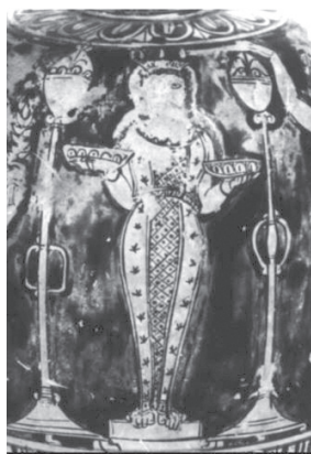
Raffigurazioni di statue su pitture vascolari greche ed italice